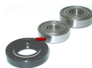
CUSCINETTO KIT(6203+6204+25X 47X10 DOPPIO)