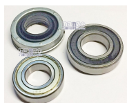
CUSCINETTO KIT(6206+6207+AT 35X72X19)