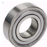
CUSCINETTO 25X52X15 6205