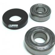
CUSCINETTO KIT(6202+6203+22X 40X8.5DT)