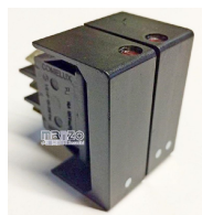
INTERRUTTORE DOPPIO CALDOBAGNO