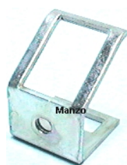
STAFFE FISSAGGIO RUBINETTO