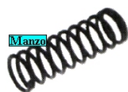
MOLLA X RUBINETTO GAS