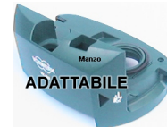
CORPO SUPERIORE SACCO VK122 ADATTABILE