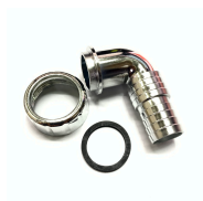
RACCORDO A MURO PER TUBO SCARICO F 1 T/19/22